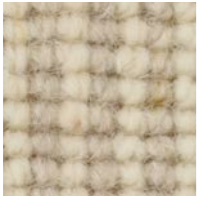
hellbeige mittelbeige 4143