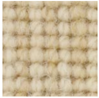
hellbeige sisal 4152